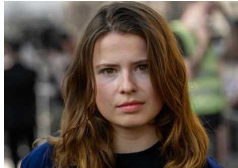
Luisa Neubauer

Luisa Neubauer (*1996) ist eine deutsche Klimaschutzaktivistin. In Deutschland ist sie eine der Hauptorganisatorinnen des von Greta Thunberg inspirierten Schulstreiks Fridays for Future („Klimastreik“). Sie tritt für eine Klimapolitik ein, die mit dem Übereinkommen von Paris vereinbar ist, und wirbt für einen Kohleausstieg Deutschlands bis 2030.